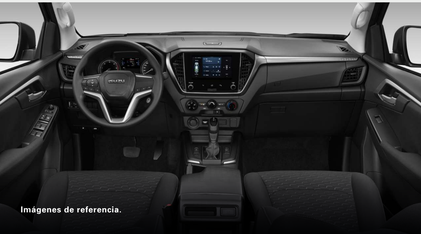
Imágenes de referencia.