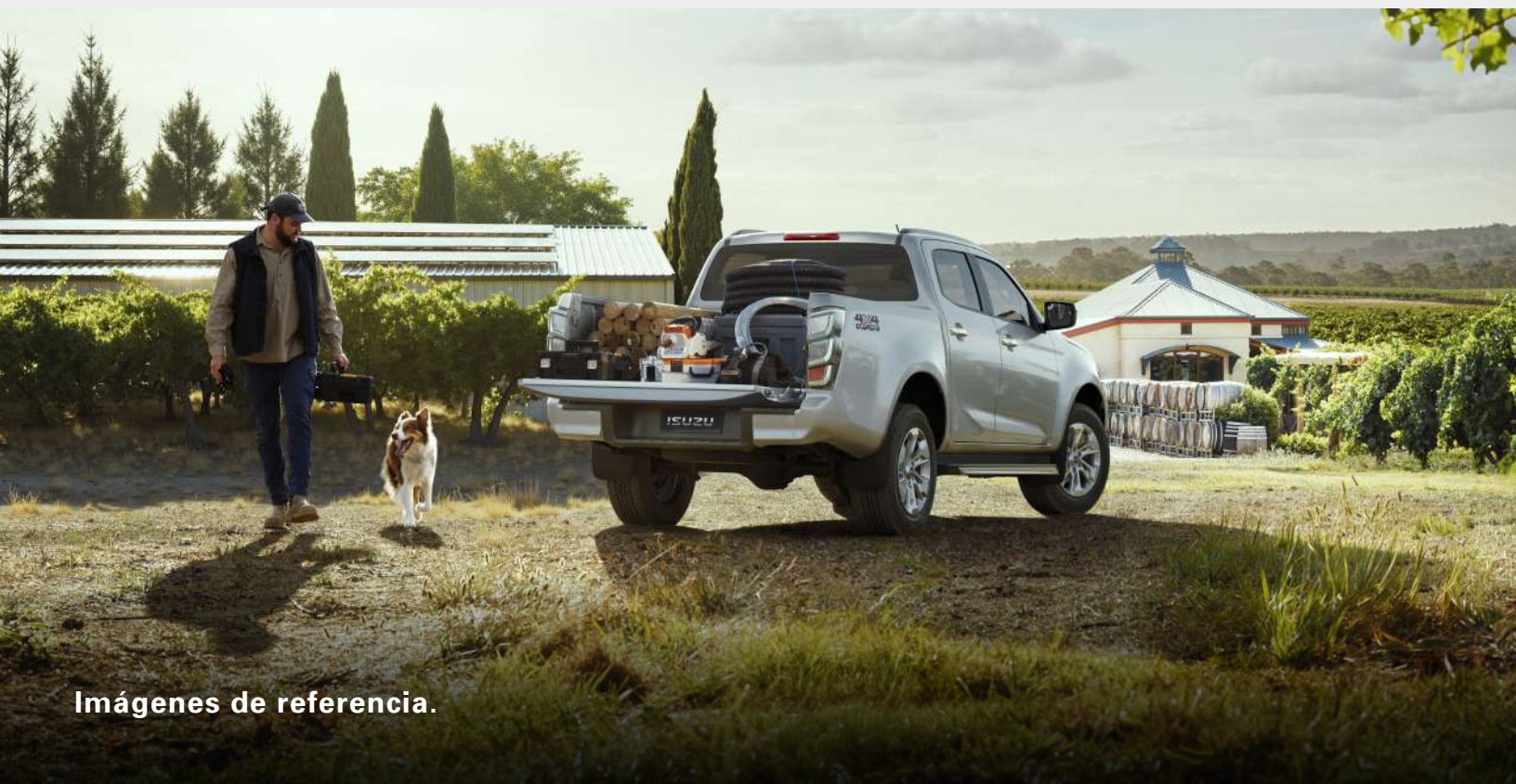
Imágenes de referencia.