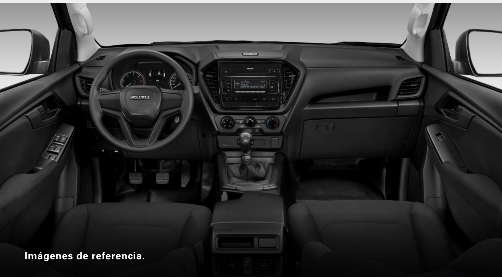
Imágenes de referencia.